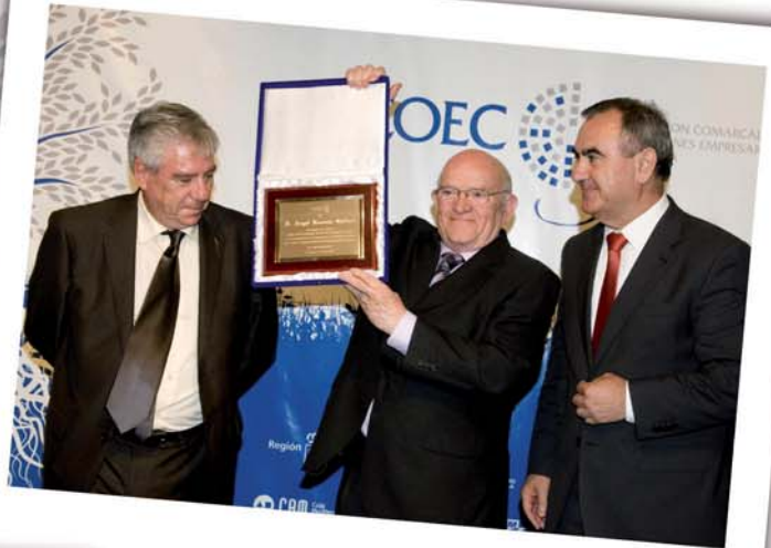
Ángel Lorente, ex-presidente de COEC.