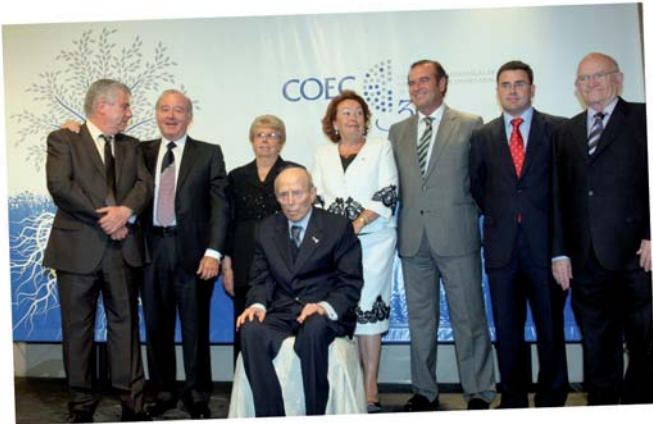
Foto de familia de todos los homenajeados y premiados con la Excelencia Empresarial.