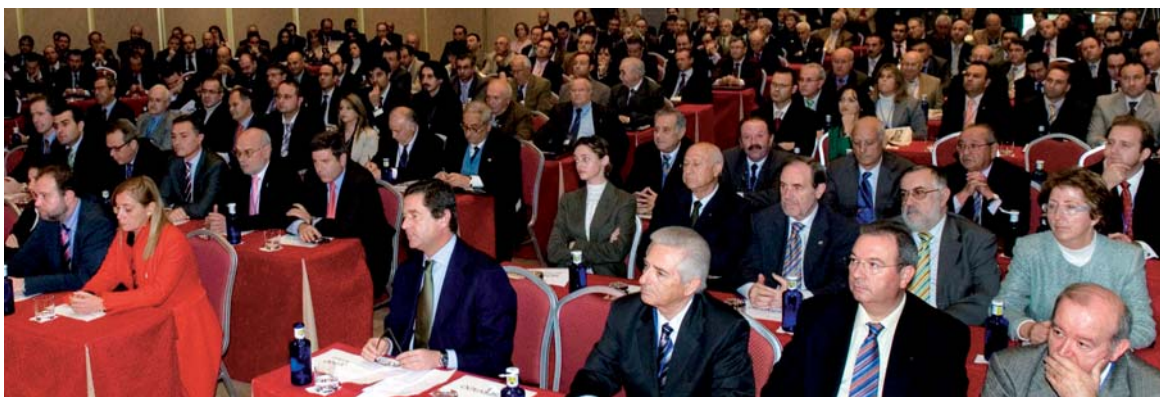
Vista del salón de conferencias del Hotel El Lago de La Torre (Torre Pacheco).