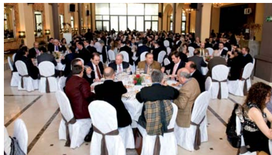
Al finalizar la Jornada, se sirvió a los asistentes un almuerzo.

Por su parte, la Alcaldesa de Cartagena, Pilar Barreiro, hizo suyas las reivindicaciones de los empresarios en infraestructuras y en la lucha por evitar el aislamiento, y lamentó que inversiones como la del AVE "estén paralizadas en beneficio de otras comunidades".